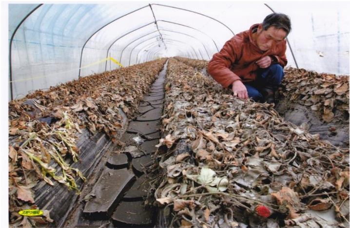
東日本大震災の津波の被害直後の写真