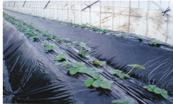
（左側写真：アーケイオン土壌改良剤散布後作付） アーケイオン土壌改良剤30倍に薄め散布